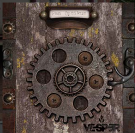
2018 Pan Optikum