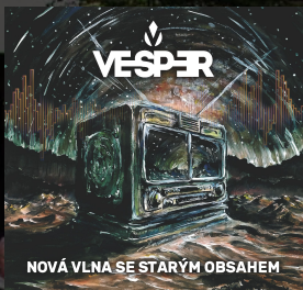
2023 Nová vlna se starým obsahem