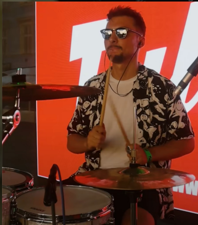
Vesper | promo video