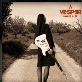
2015 Smrti blíž