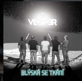
2016 Blýská se tkání